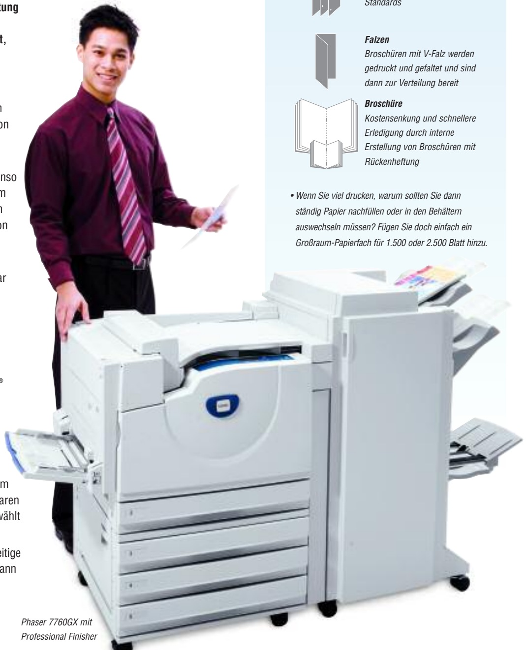
Phaser 7760GX mit Professional Finisher